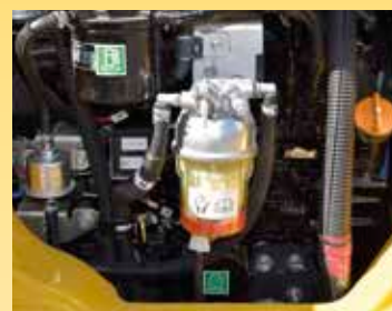
Grande filtro e prefiltro del carburante con separatore di acqua per proteggere il motore