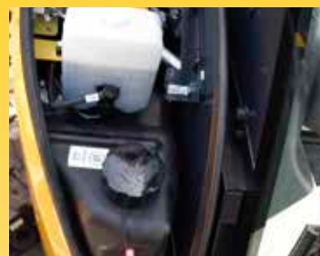
Rifornimento comodo e sicuro di olio e carburante sotto il cofano anteriore