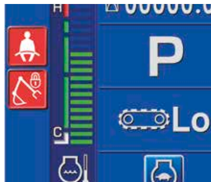
Avviso cintura di sicurezza e avviso impianto rilevamento posizione neutra