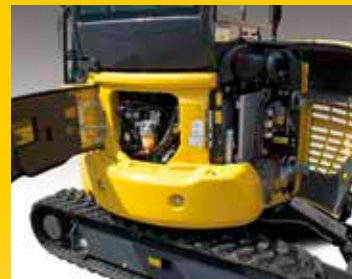
Cofani posteriori per controllo del motore, rifornimento carburante, ispezione e pulizia dei radiatori ed accesso alla batteria

L'adozione di connettori idraulici a faccia piana ORFS ed elettrici di tipo DT non solo aumenta l'affidabilità, ma rende più facili e rapidi eventuali interventi di riparazione. Boccole ad alta durabilità e un intervallo di 500 ore per la sostituzione dell'olio motore riducono ulteriormente i costi operativi.