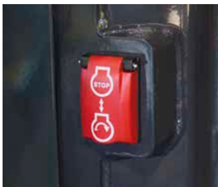
Interruttore secondario di spegnimento motore