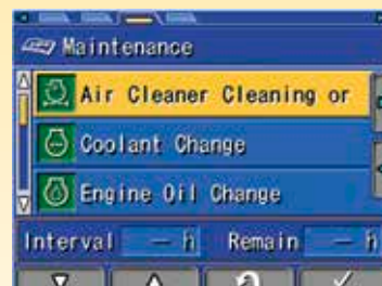
Monitor multifunzione per fornire all'operatore informazioni sullo stato di manutenzione