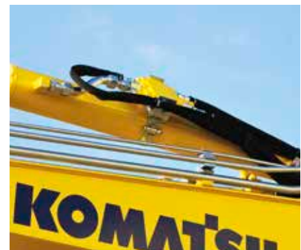
Valvole di sicurezza cilindri braccio e avambraccio